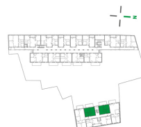
Lage im Objekt

Rankengasse EG / TOP 2 1. OG / TOP 102 / TOP 103 2. OG / TOP 202 / TOP 203 3. OG / TOP 302 / TOP 303 4. OG / TOP 402 / TOP 403 ☐ gespiegelter Grundriss