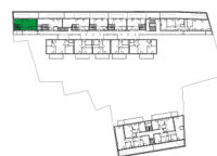
Lage im Objekt