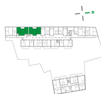
Lage im Objekt

Karlauerstraße 1. OG / TOP 106 / TOP 107 ↕ 2. OG / TOP 206 / TOP 207 ↕ 3. OG / TOP 306 / TOP 307 ↕ 4. OG / TOP 406 / TOP 407 ↕ ↕ gespiegelter Grundriss