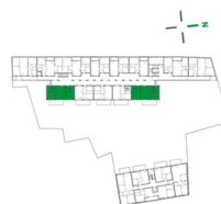
Lage im Objekt

Karlauerstraße 1. OG / TOP 109 / TOP 112 ↕ 2. OG / TOP 209 / TOP 213 ↕ 3. OG / TOP 309 / TOP 313 ↕ 4. OG / TOP 409 / TOP 413 ↕ 5. OG / TOP 508 / TOP 512 ↕ ↕ gespiegelter Grundriss