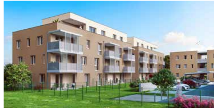
8141 Premstätten Hauptstraße 161a, 161b, 161c