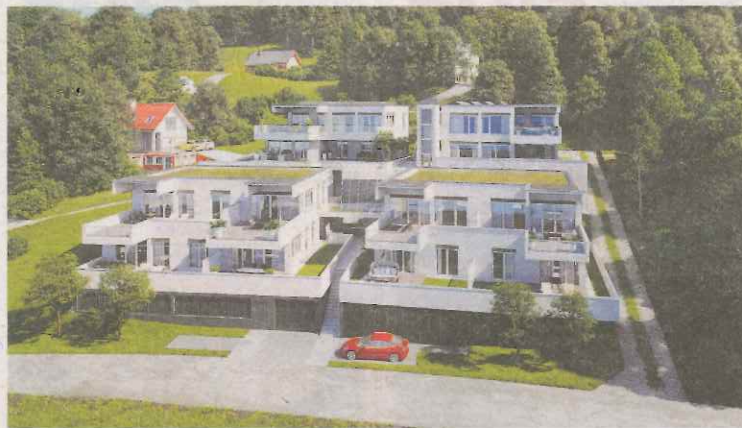
Traumhafte Aussichten bei gleichzeitiger Uneinsehbarkeit GWS

Ganz persönliches Wohnglück. Bei Wohnflächen von 66 bis 149 Quadratmetern findet jeder sein individuelles Wohnglück – schließlich gleicht keine Wohnung der anderen. Moderne, lichtdurchflutete Grundrisse und Raumhöhen bis 280 cm sorgen für ein